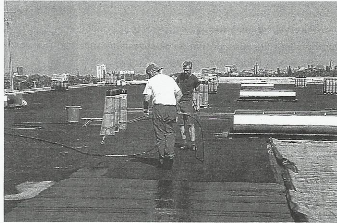
Derbigum was een pionier in België op het gebied van recyclage in de sector van de dakwerkers.