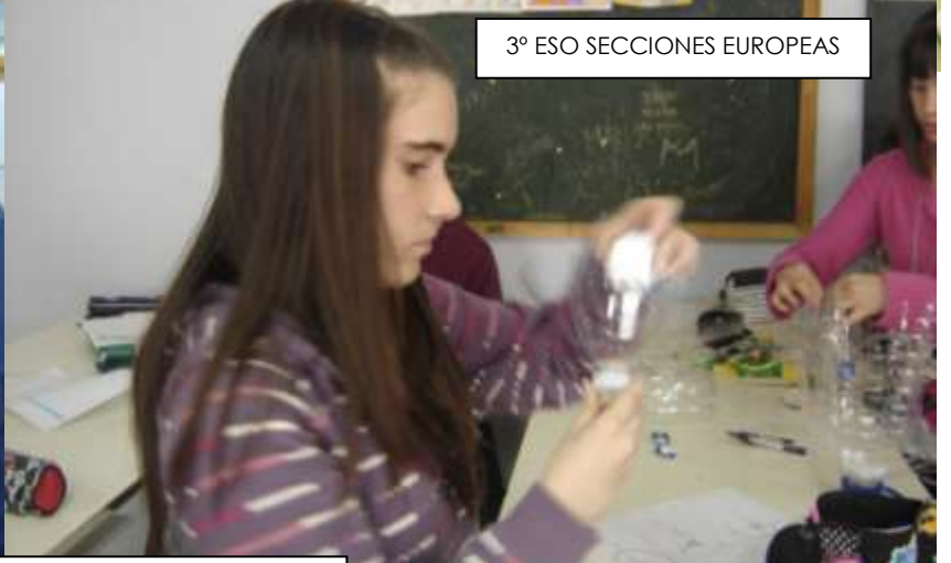
3° ESO SECCIONES EUROPEAS